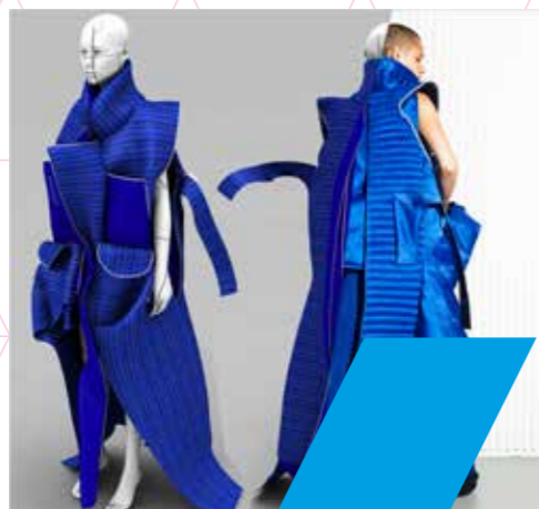
BOVEN Tentoonstelling Work in Progress